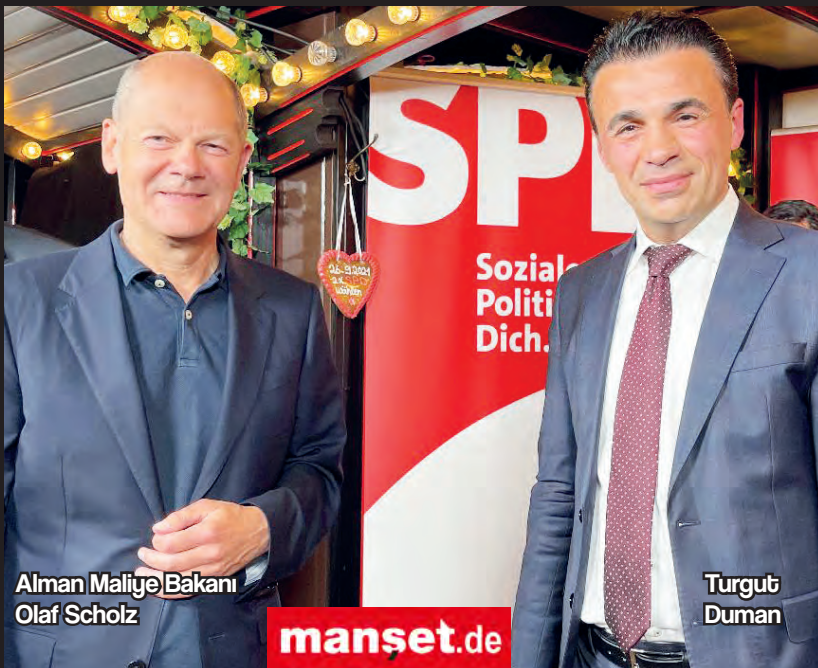
Alman Maliye Bakanı Olaf Scholz

Alman Maliye Bakanı Olaf Scholz'un da katıldığı toplantıda konuşan Scholz, evliliğin çok değerli bir kurum olduğunu, kendisinin de mutlu bir evliliği sürdürdüğünü belirtti. Düğünlerin yavaş yavaş normale dönmesi gerektiğini, bunun aile yapısı için önemli olduğunu söyle-