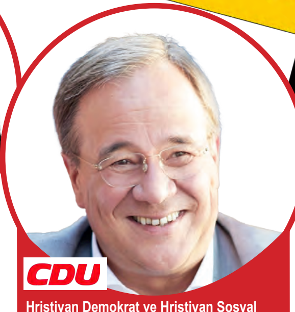
CDU Hristiyan Demokrat ve Hristiyan Sosyal Birlik Parti (CDU/CSU) adayı Armin Laschet

belirleneceği seçimde, Sosyal Demokrat Parti (SPD) adayı Olaf Scholz, Hristiyan Demokrat ve Hristiyan Sosyal Birlik Parti (CDU/CSU) adayı Armin Laschet ve Yeşiller Parti'sinden (DIE GRÜNEN) Almanya'nın en genç adayı Annalena Baerbock kıyasıya başbakanlık yarışına katılacaklar. Başbakanlık adaylığının açıklanmasıyla yükselişte olan Annalena Baerbock, daha sonra bazı olumsuzluklar sebebiyle düşüşe geçerken, son zamanlarda yapılan anketlere göre Federal Maliye Bakanı ve Başbakan Yardımcısı Olaf Scholz'un adaylar arasında yükselişe