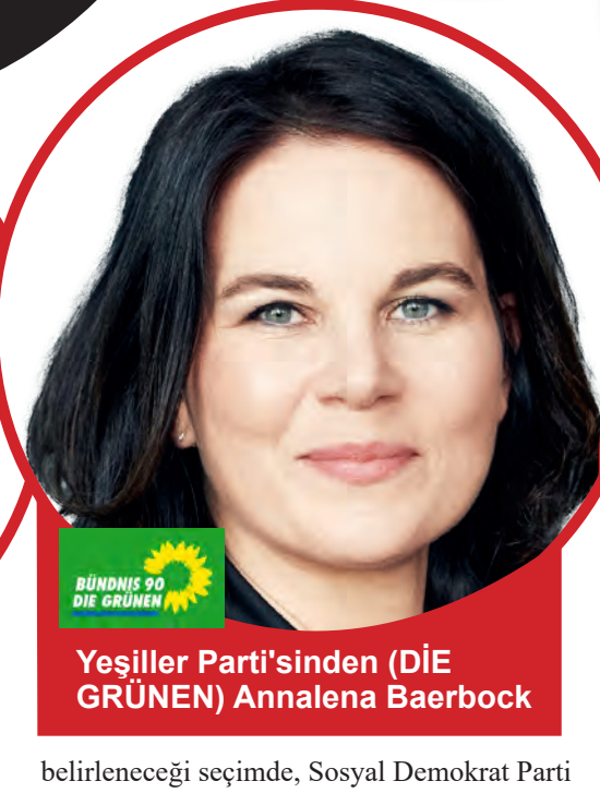
BÜNDNIS 90 DIE GRÜNEN Yeşiller Parti'sinden (DIE GRÜNEN) Annalena Baerbock