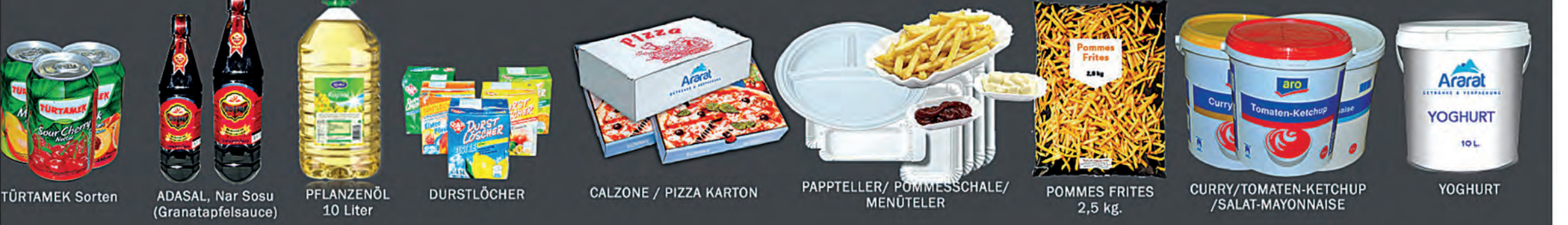
TÜRTAMEK Sorten ADASAL, Nar Sosu (Granatapfelsauce) PFLANZENÖL 10 Liter DURSTLÖCHER CALZONE / PIZZA KARTON PAPPTELLER/ POMMESSCHALE/ MENÜTELER POMMES FRITES 2,5 kg. CURRY/TOMATEN-KETCHUP /SALAT-MAYONNAISE YOGHURT