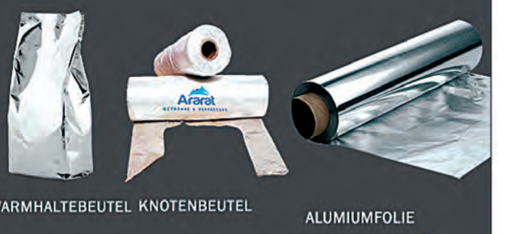
WARMHALTEBEUTEL KNOTENBEUTEL ALUMIUMFOLIE