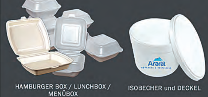
HAMBURGER BOX / LUNCHBOX / MENÜBOX ISOBECHER und DECKEL