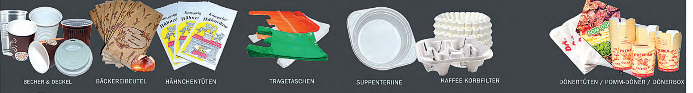
BECHER & DECKEL BÄCKEREIBEUTEL HÄHNCHENTÜTEN TRAGETASCHEN SUPPENTERIINE KAFFEE KORBFILTER DÖNERTÜTEN / POMM-DÖNER / DÖNERBOX