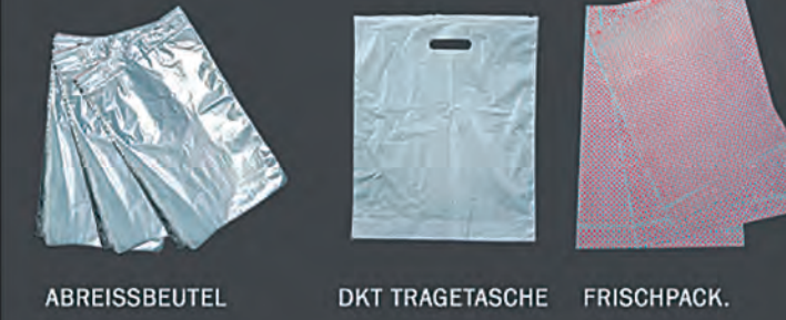
ABREISSBEUTEL DKT TRAGETASCHE FRISCHPACK.