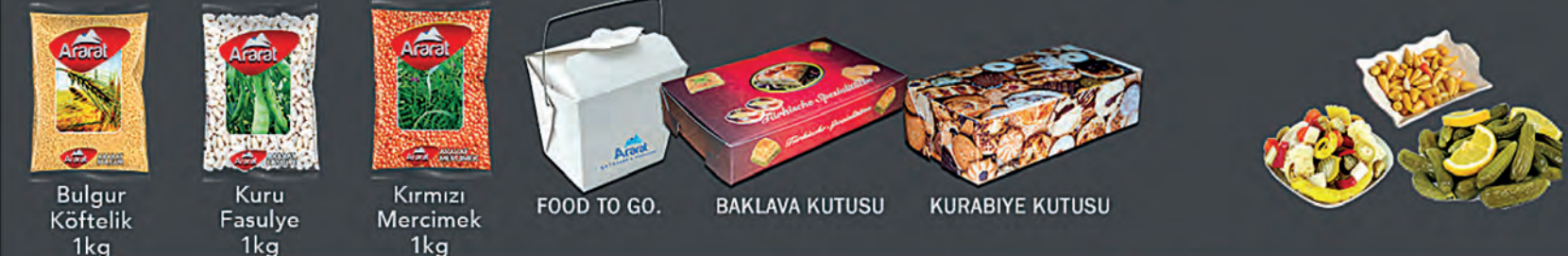
Bulgur Köftelik 1kg Kuru Fasulye 1kg Kırmızı Mercimek 1kg FOOD TO GO. BAKLAVA KUTUSU KURABIYE KUTUSU