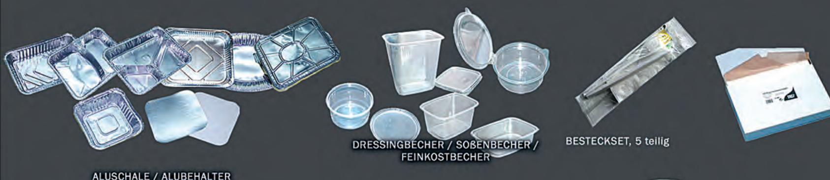
ALUSCHALE / ALUBEHALTER DRESSINGBECHER / SOBENBECHER / FEINKOSTBECHER BESTECKSET, 5 teilig RÜHRSTÄBCHEN GABEL, LÖFFEL, HANDTUCHROLLEN, MESSER