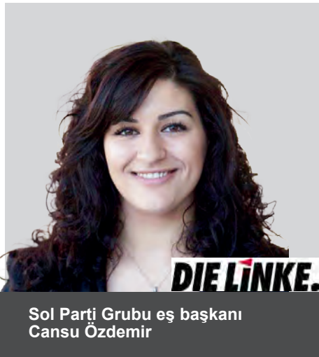
DIE LINKE. Sol Parti Grubu eş başkanı Cansu Özdemir