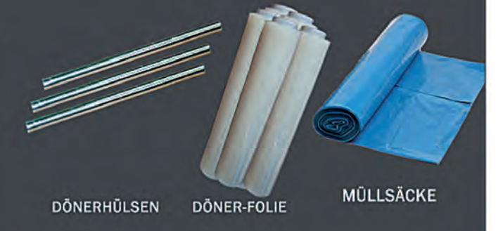
DÖNERHÜLSEN DÖNER-FOLIE MÜLLSÄCKE