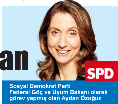
SPD Sosyal Demokrat Parti Federal Göç ve Uyum Bakanı olarak görev yapmış olan Aydan Özoğuz