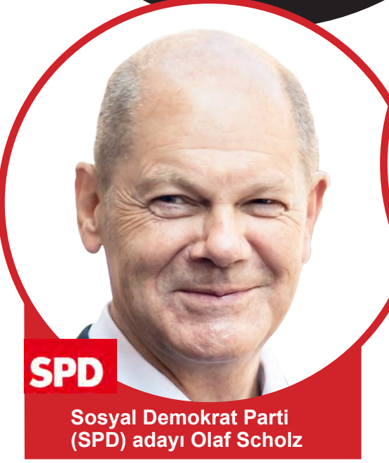
SPD Sosyal Demokrat Parti (SPD) adayı Olaf Scholz