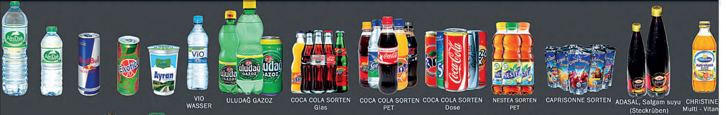
VIO WASSER ULUDAĞ GAZOZ COCA COLA SORTEN Glas COCA COLA SORTEN PET COCA COLA SORTEN Dose NESTEA SORTEN PET CAPRISONNE SORTEN ADASAL, Salgam suyu (Steckrüben) CHRISTINE Multi - Vitamin

Geniş ürün yelpazesi Uygun fiyat Toptan ve Perakende satış İmbiş'lere yönelik her çeşit Ambalaj ürünleri bulunur.