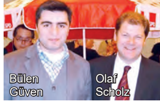
Bülent Güven Olaf Scholz

Eyalet İç İşleri Bakanlığı, Eyalet Başbakanlığı daha önce Çalışma Bakanlığı en son Maliye Bakanlığı ve Başbakan yardımcılığı yaptı. Dolayısıyla tecrübesinden dolayı iyi bir başbakanlık yapacağını düşünüyorum. Scholz'u yakından tanıyan bir insan olarak da biliyorum ki, entelektüel donanımı çok iyi. Kendisi Hamburg Eyalet Başkanı iken o dönemleri de biliyorum, çok okuyan, ufku çok geniş bir insan. Bir de bence Almanya'da gelmiş başbakanlar arasında göçmenleri ve Türkleri, Müslümanları en yakından tanıyan ve onlara olumlu bakan bir başbakan. Dolayısıyla ben Scholz'u buradaki Türk ve Müslüman göçmen kökenli insanlar için de bir şans olarak görüyorum. Zaten bunun ilk işaretlerini de hükümet programlarında verdi. Çifte vatandaşlığı mümkün yapacağını söyledi. Dolayısıyla Scholz'un hem Almanya için hem Avrupa Birliği için hem de göçmenler için iyi bir başbakan olacağını düşünüyorum.